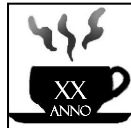
Spettatore in Abbonamento Postale D.L. 358/2003 (norm. int. 2/10/2004 n. 49) art. 1, comma 1, DDB Caserta